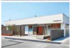
加納会館 東豊中 豊中市東豊中町6-1-39