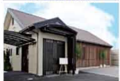
加納会館 鉢塚 池田市鉢塚3-11-19