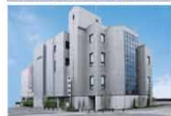
加納会館(本館) 豊中市中桜塚2-12-2