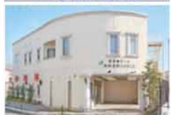
加納会館 ファミリエ 豊中市中桜塚5-15-3