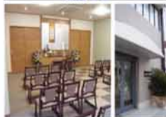
ファミリエ 法要会館 豊中市中桜塚5-15-8