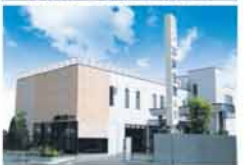
加納会館 今宮 箕面市今宮3-2-13